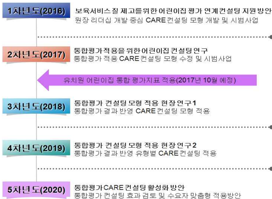
[그림 1] 어린이집 평가 연계 컨설팅 지원 방안 5차년 연구계획

□ 2016년부터 2020년까지 각 년도의 주요 연구계획은 다음 <그림 1>과 같음.